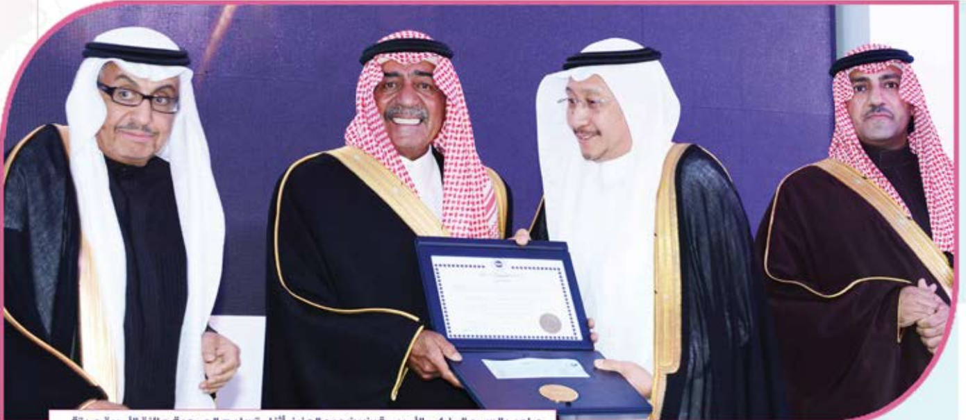
صاحب السمو الملكي الأمير مقرن بن عبد العزيز أثناء تسليم الجمعية جائزة الأميرة صيته