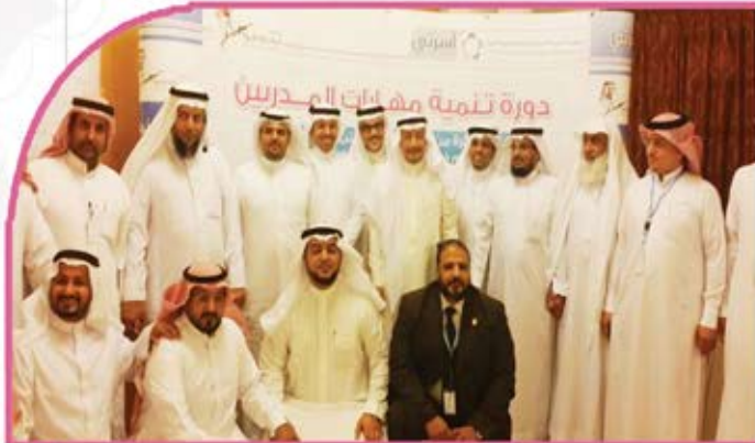
صورة جماعية للمدربين بعد إتمام دورة تنمية مهارات المدربين بفندق المريديان