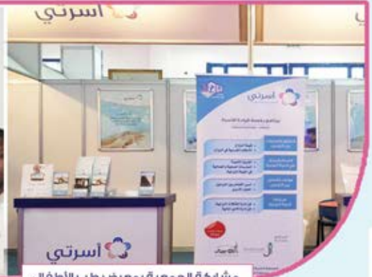
مشاركة الجمعية بمعرض طب الأطفال