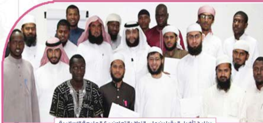
برنامج تأهيل المقبلين على الزواج بالتعاون مع الجامعة الإسلامية