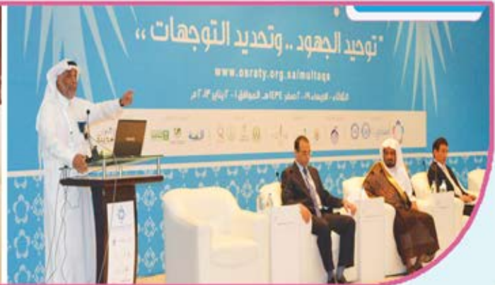
الملتقى السادس لجمعيات الزواج بالمملكة والذي نظّمته جمعية التنمية الأسرية (أسرتي) بالمدينة