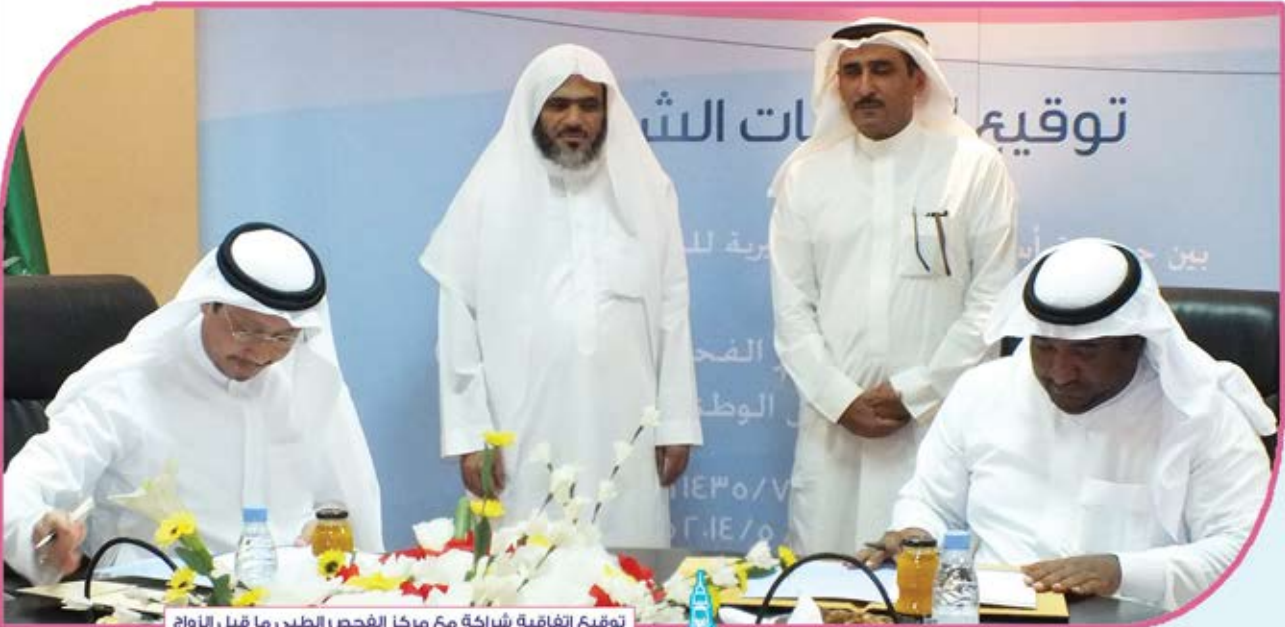
توقيع اتفاقية شراكة مع مركز الفحص الطبي ما قبل الزواج