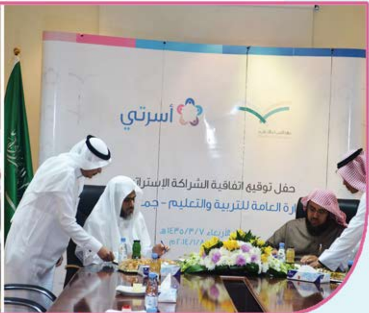
اتفاقية شراكة لتقديم برامج الجمعية لطلاب وطالبات إدارة التعليم بمنطقة المدينة المنورة