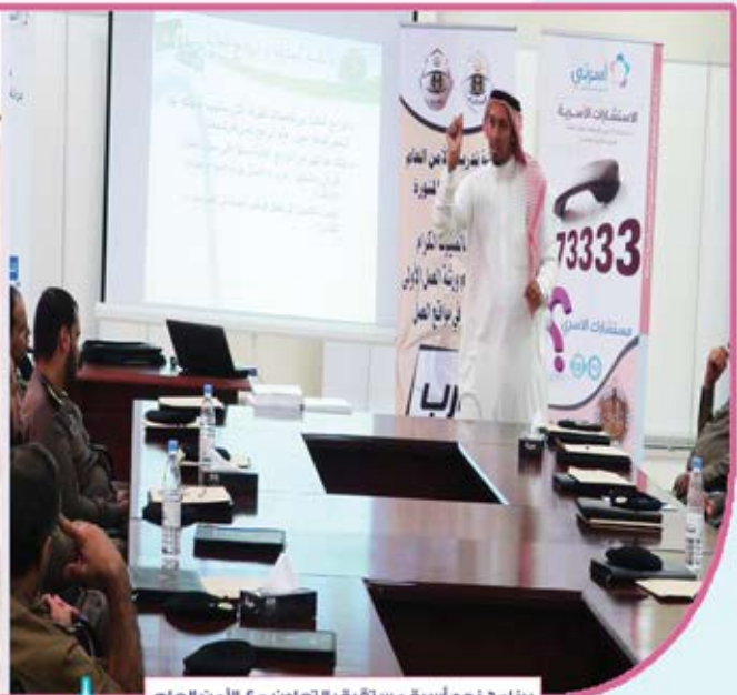
برنامج نحو أسرة مستقرة بالتعاون مع الأمن العام