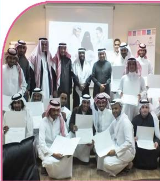
صورة جماعية للمدربين بعد إتمام برنامج تأهيل المقبلين على الزواج بمقر الجمعية بالمدينة المنورة