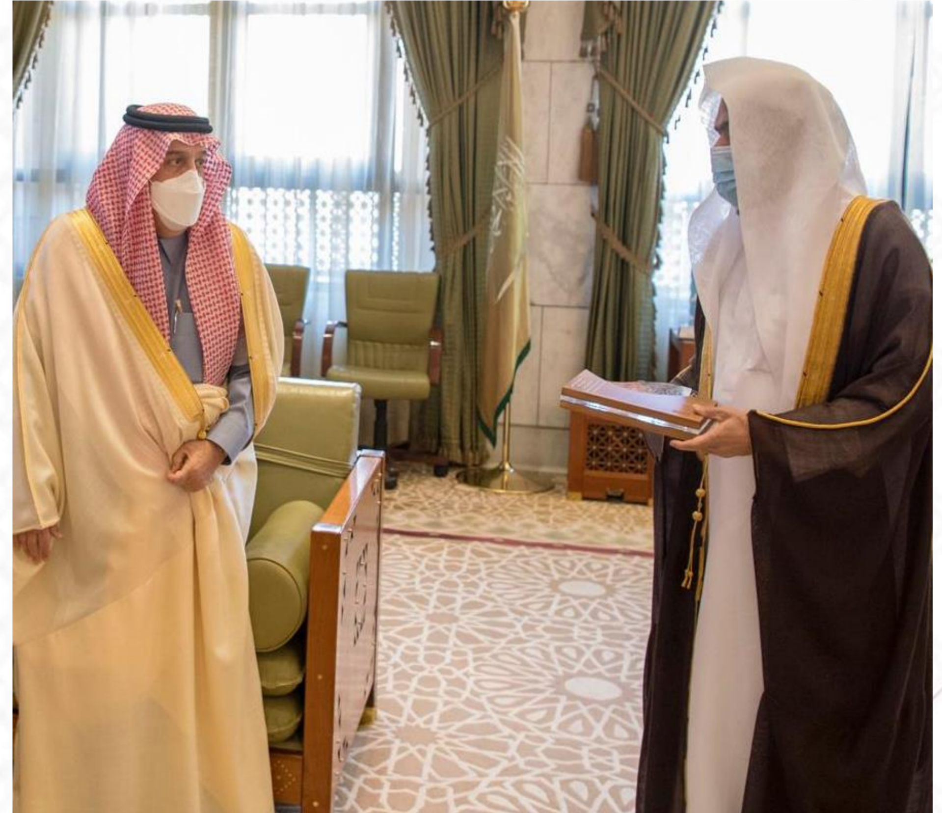
جائزة التميز في العمل الخيري ٢٠٢٠م