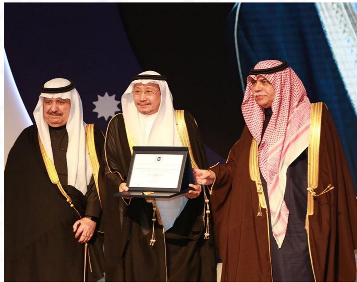
جائزة الأميرة صيتة ٢٠١٤م