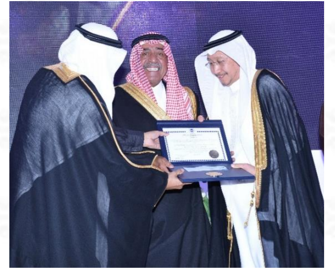
جائزة الأميرة صيتة ٢٠١٥م