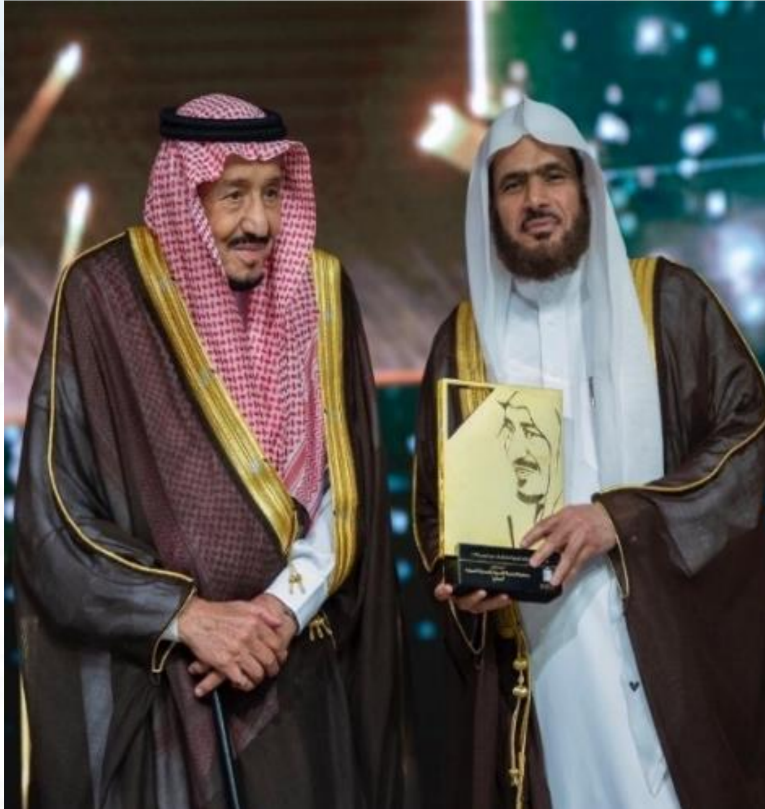
جائزة الملك خالد ٢٠١٩م