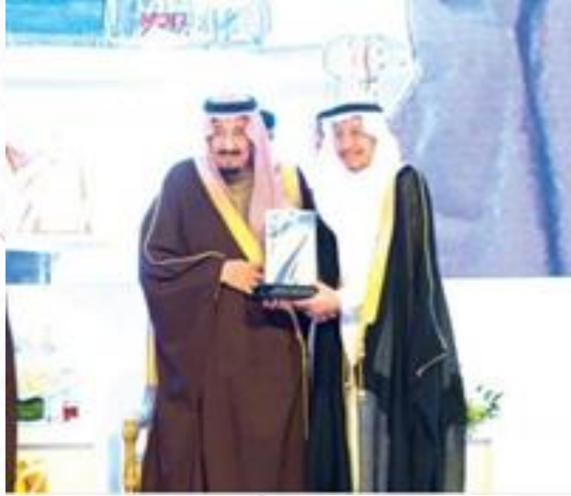
جائزة الملك خالد ٢٠١٦م