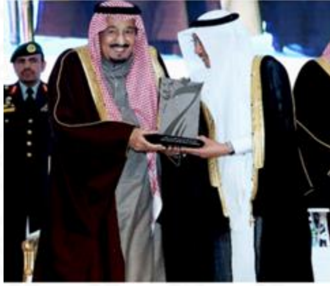
جائزة الملك خالد ٢٠١٧م