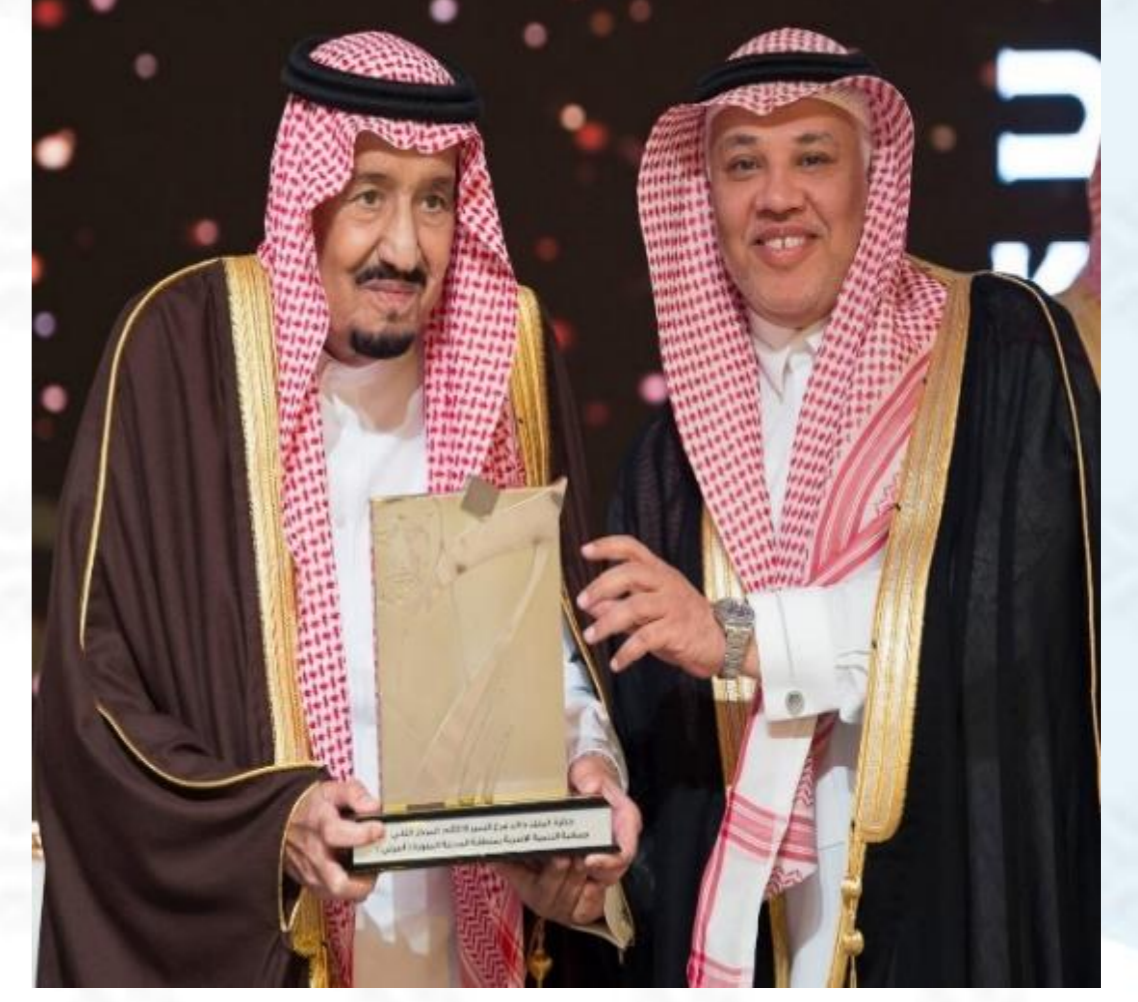
جائزة الملك خالد ٢٠١٨م