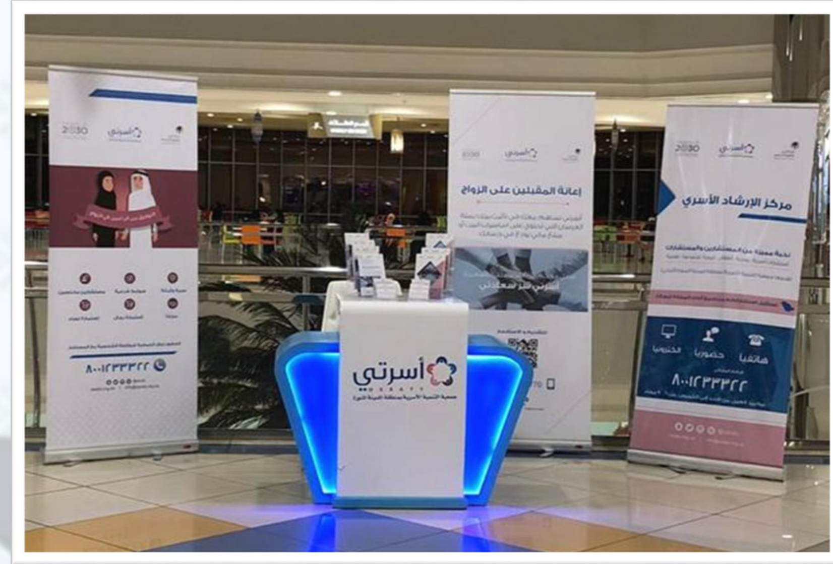
الركن التعريفي بالراشد ميغا مول