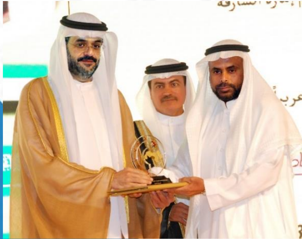
جائزة الشارقة للعمل التطوعي ٢٠١٣م